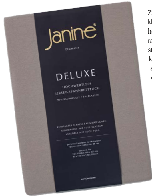
Die neue Spannbettuchlinie „Deluxe“ gibt es in 36 Farben und drei Größen.