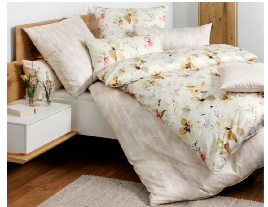
Für jeden Geschmack etwas dabei: Das Janine Bettwäsche-Sortiment vereint Optik, Qualität und Vielfalt.